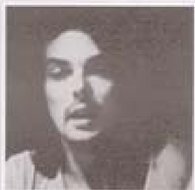
sogno di una notte d'estate